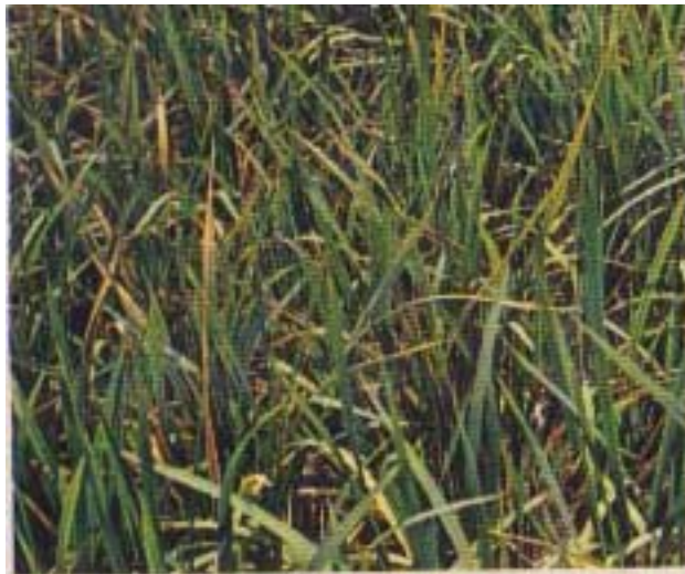
Gambar 4. Kekurangan unsur kalium ( Potassium deficiency ) pada tanaman padi (van Breemen and Moorman, 1978)

Penggenangan pada tanah Ultisol di Tugumulyo, Sumsel, yang baru dibuka 5 tahun dan 1 tahun, meningkatkan kadar Fe terlarut berturut-turut dari 0,33 menjadi 74,13 ppm dan dari 0,07 menjadi 62,07 ppm. Mangan, seng, dan tembaga terlarut berkurang dengan penurunan Eh, demikian juga kadar nitrat, amonium, kalium dan magnesium menurun dengan semakin rendahnya nilai potensial redoks. Tetapi kadar sulfat meningkat sampai Eh 115 mV, kemudian menurun kembali sampai Eh -72 mV pada tanah yang baru dibuka 1 tahun. Pemberian Fe 200 ppm pada tanaman padi sudah menunjukkan gejala bronzing , meningkatkan kadar Fe tanaman dan menurunkan serapan hara P, K, Ca, Mg dan meningkatkan nisbah Fe/P, Fe/K dan Fe/Ca tanaman (Hartatik, 1998).