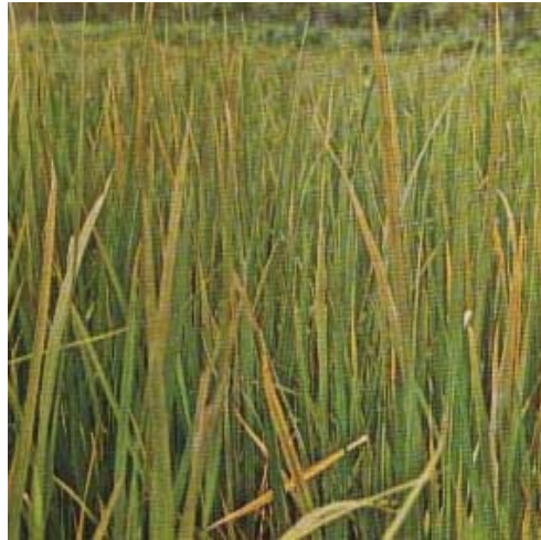
Gambar 1. Keracunan besi ( iron toxicity ) pada tanaman padi (Van Breemen and Moorman, 1978)

Keracunan besi terlihat bila kadar besi dalam tanah 20–40 mg l -1 (van Breemen and Moorman, 1978). Menurut Van Mensvoort et al. , (1985) bila kadar hara lain sangat rendah atau dalam keadaan hara tidak seimbang, keracunan besi akan nampak bila kadar besi dalam tanah 30 mg l -1 (Gambar 1).